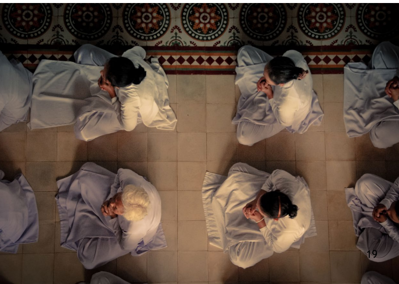
Meditation i ett tempel i Sydasiien.

Frågan är alltså inte om en begränsning är önskvärd, utan om den har en legitim grund (till exempel att skydda den allmänna hälsan), är nödvändig och föreskriven i lag. Dessutom innebär skyddet för religionsfrihet ett förbud mot bestämmelser som uttryckligen riktar sig mot någon viss religionsutövning eller som uppenbart syftar till att motverka en viss övertygelse.