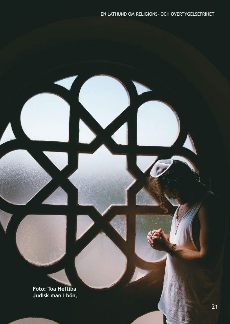
Judisk man i bön.